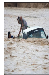
مدیرعامل جمعیت هلال احمر خوزستان :

نابسامانی بازار روغن موتور حاصل انحصار است ۲