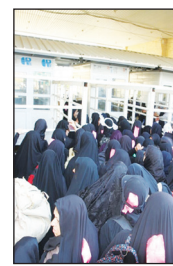
به دلیل آمادگی زیر ساخت‌ها :