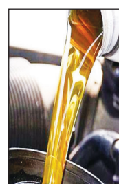
نائب رئیس کمیسیون صنایع و معادن مجلس :

نابسامانی بازار روغن موتور حاصل انحصار است ۲