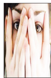
زوج های جوان بخوانند :

اضطراب‌هایی که زندگی شما را مختل می کند ۵